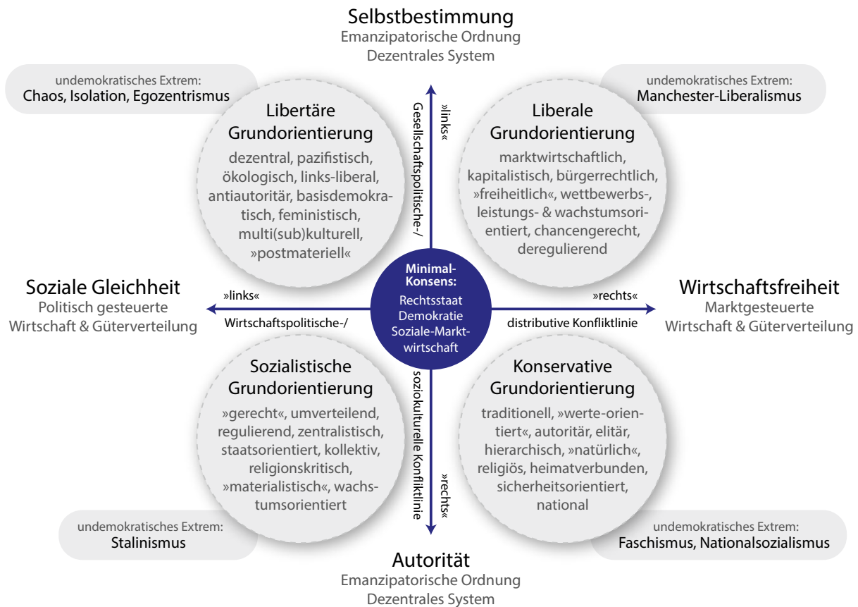
Abb. 1: Der Kompass der vier politischen Grundorientierungen.